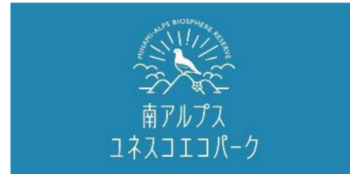
図2 南アルプスユネスコエコパーク