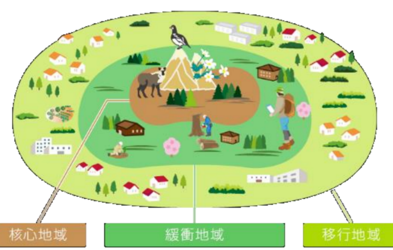
図3 ユネスコエコパーク 3つの機能と3つのゾーン（地域）