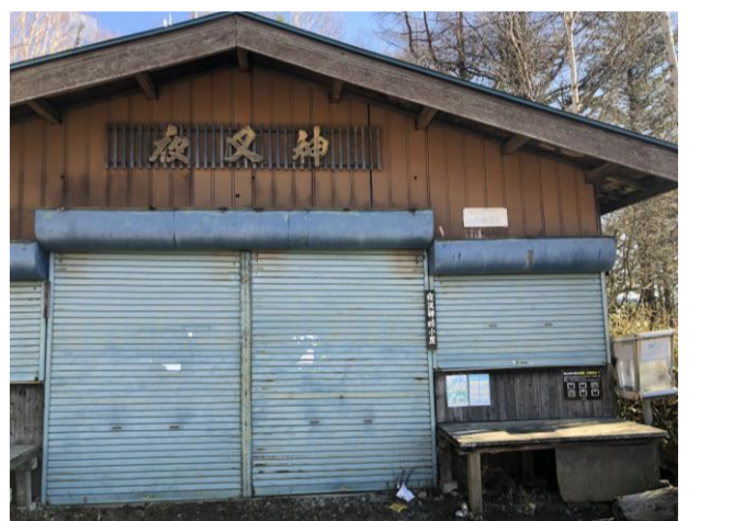
図7 夜叉神峠山頂の小屋