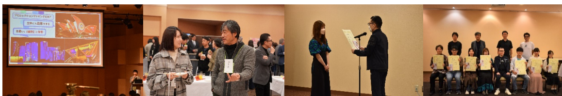
【※アイデアコンテスト&交流会&表彰式の様子】

※過去のイベント⇒ https://miraiken.yamanashi.jp/realfunding/